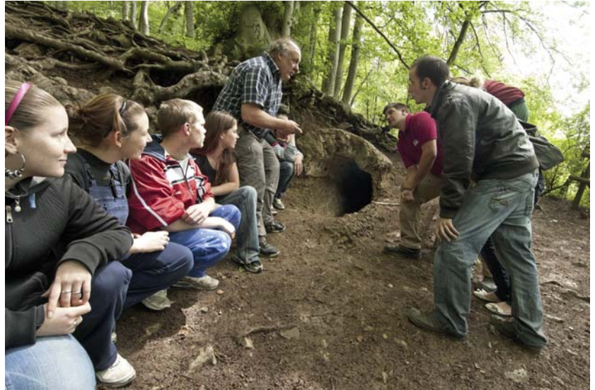
Jugendgruppe am Römerkanal in Kall-Dalbenden (Foto: M. Thuns, LVR-ABR).