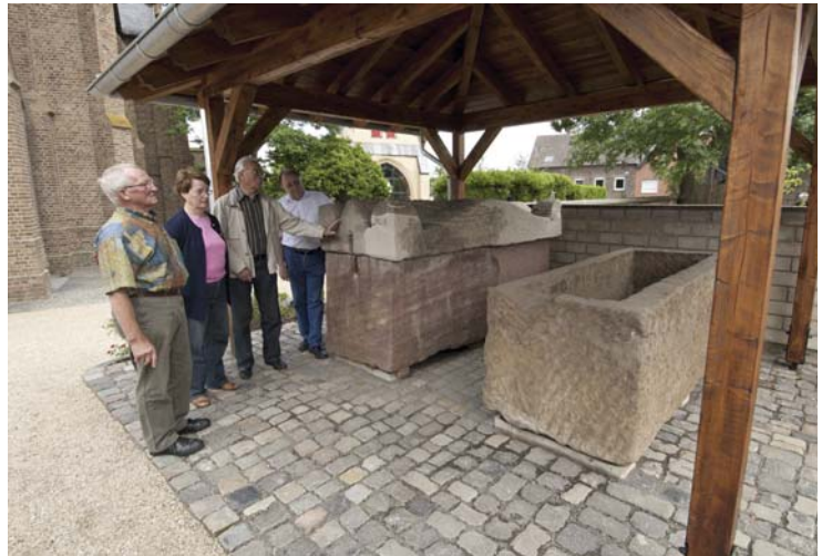
Aufstellungsort der spätantiken Sarkophage auf dem Friedhof von St. Kunibert in Zülpich-Enzen (Foto: M. Thuns, LVR-ABR).

Verkehrsamt Zülpich Markt 21, 53909 Zülpich Tel 02252 52-212, Fax 02252 52-299 hgduck@stadt-zuelpich.de www.stadt-zuelpich.de